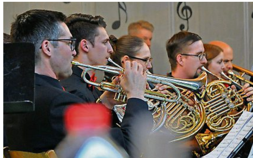
Feldmusik Ebikon während einer ihrer Konzerte.