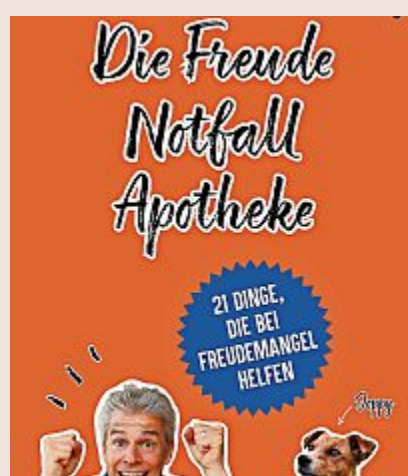
Die Freude Notfall Apotheke - Thomas Brezina, edition-a ISBN: 978-3-99001-310-6

Thomas Brezina wurde mit seinem ersten Sachbuch für Erwachsene, «Tu es einfach und glaub daran», zu Österreichs Botschafter der Freude. Jetzt legt er eine bunte «Freude Notfall Apotheke» für schwarze Tage vor. In diesem 160-seitigen Werk sind 21 Vorschlägen zum Ausprobieren enthalten. Eine Lektüre, die glücklich macht und für gute Laune sorgt. So schreibt er beispielsweise: «Wenn mich Leute einschüchtern ziehe ich ihnen das letzte Hemd aus. Zumindest in Gedanken.» pd/su